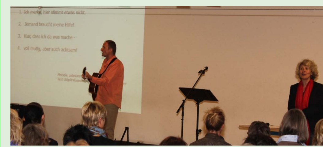
Der Elternabend „Zivilcourage fällt nicht vom Himmel“