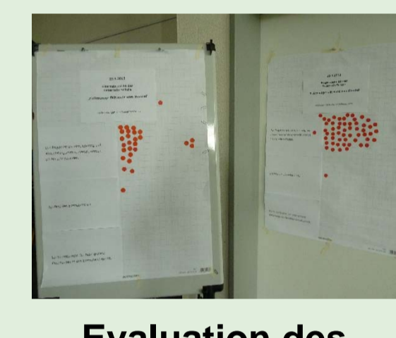
Evaluation des Elternabends