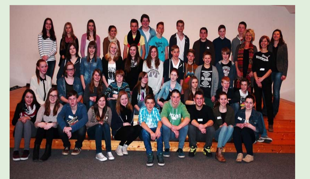
Die teilnehmenden Schülerteams: Konfliktmediatoren, Klassenpaten, Busbegleiter, Medienscouts