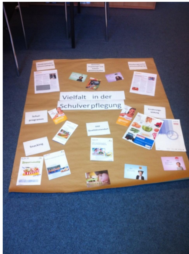
Vorbereitung des Info-Standes der Vernetzungsstelle Schulverpflegung NRW