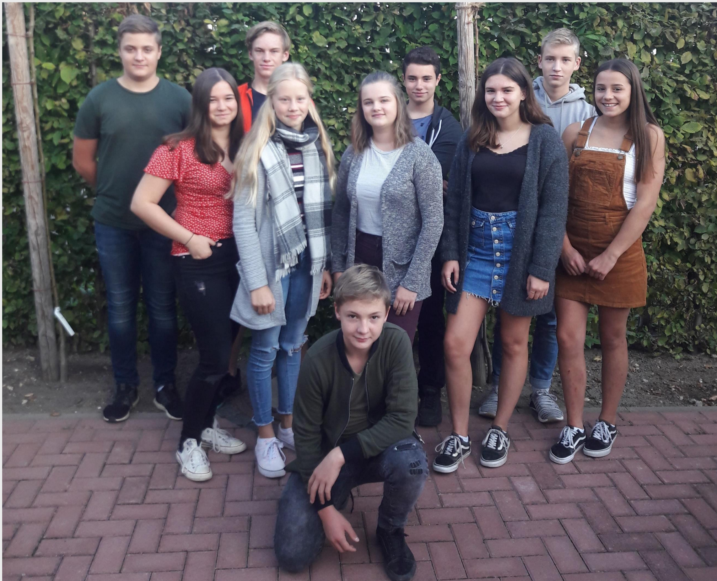
Die Schülerinnen und Schüler des B-Teams